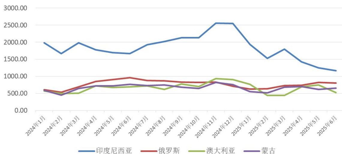
煤炭主要进口国家月度数量:万吨

进口煤方面，上半年国内煤炭市场重心整体下移，随着内贸煤价格持续下跌，进口煤到岸价跌幅不及内贸煤，使得部分进口煤价格较国内煤持续倒挂，进口煤减量态势明显。上半年我国共进口煤炭2.2亿吨，同比下降11.1%。