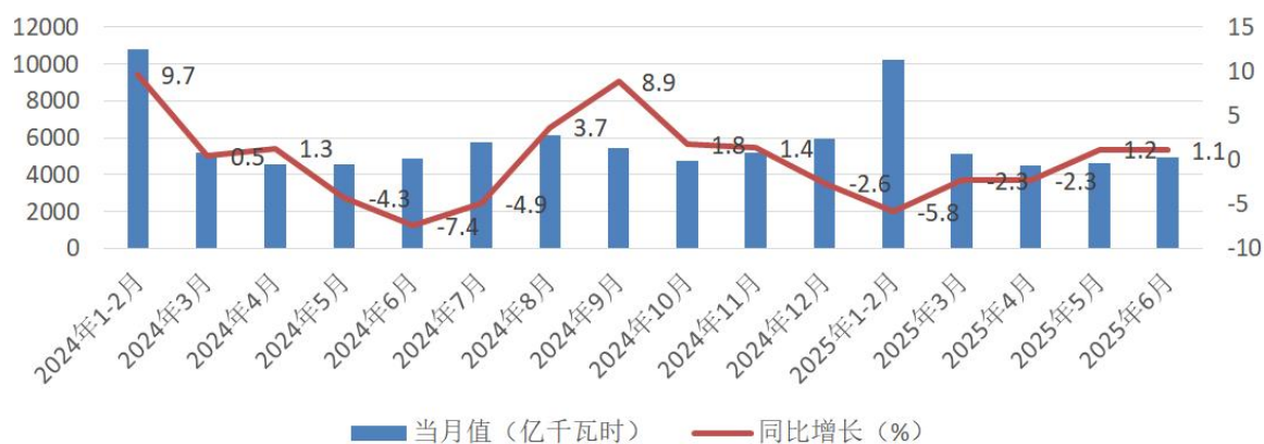
全国当月火力发电量

钢铁方面，2025年上半年全国粗钢产量5.15亿吨，同比下降3.0%。受房地产市场低迷影响，国内钢材市场终端需求释放不足，粗钢产量有所减少。