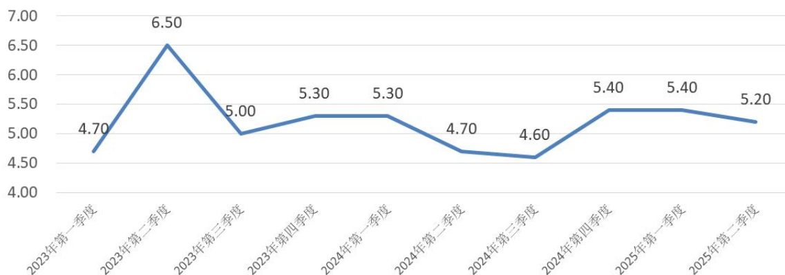
中国分季度GDP同比增速：%

从经济增长驱动因素来看，居民消费需求较快增长，消费品以旧换新政策发力显效，服务消费增势较好，消费活力不断释放，消费对经济增长的拉动作用进一步增强。上半年，最终消费支出对经济增长贡献率为52.0%，拉动GDP增长2.8个百分点。投资需求稳中有升，随着“两重”建设加快推进，“两新”政策加力扩围，有效投资持续扩大，助推经济高质量发展。上半年，资本形成总额对经济增长贡献率为16.8%，拉动GDP增长0.9个百分点。净出口方面延续平稳增长态势，我国持续推进高水平对外开放，对外贸易结构更趋优化。上半年，货物和服务净出口对经济增长贡献率为31.2%，拉动GDP增长1.7个百分点。