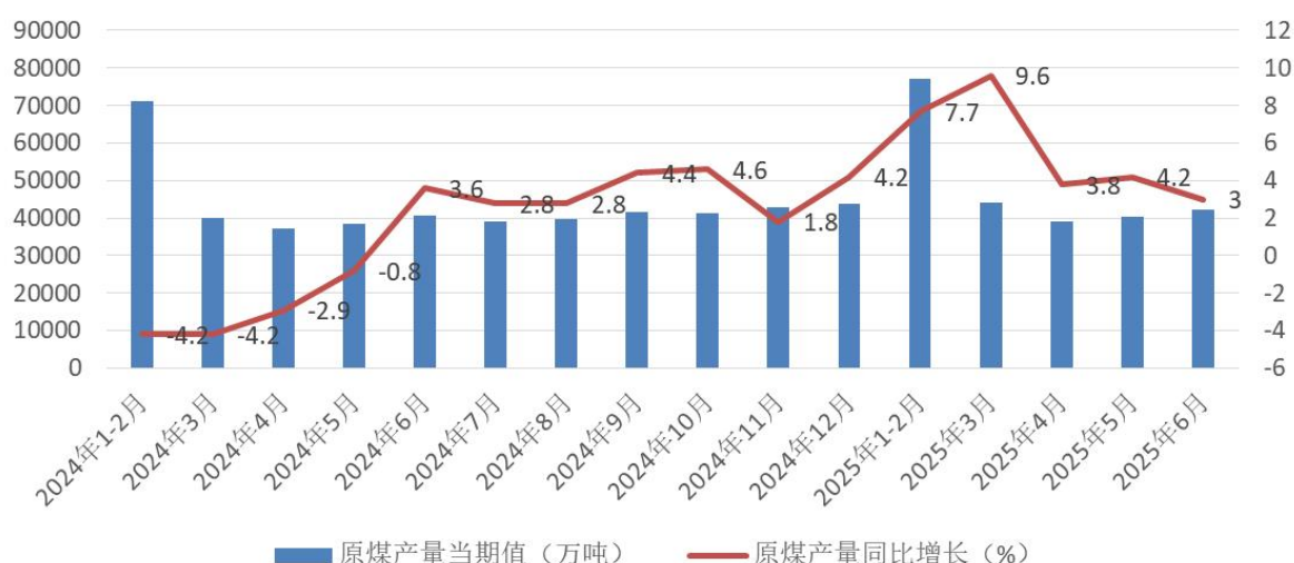
国内原煤月度产量

进口煤方面，上半年国内煤炭市场重心整体下移，随着内贸煤价格持续下跌，进口煤到岸价跌幅不及内贸煤，使得部分进口煤价格较国内煤持续倒挂，进口煤减量态势明显。上半年我国共进口煤炭2.2亿吨，同比下降11.1%。