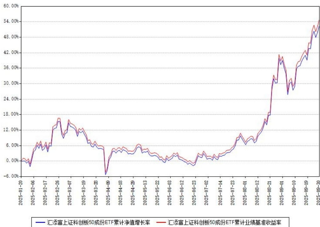
汇添富上证科创板50成份ETF累计净值增长率与同期业绩基准收益率对比图

（二）自基金合同生效以来基金累计净值增长率变动及其与同期业绩比较基准收益率变动的比较图