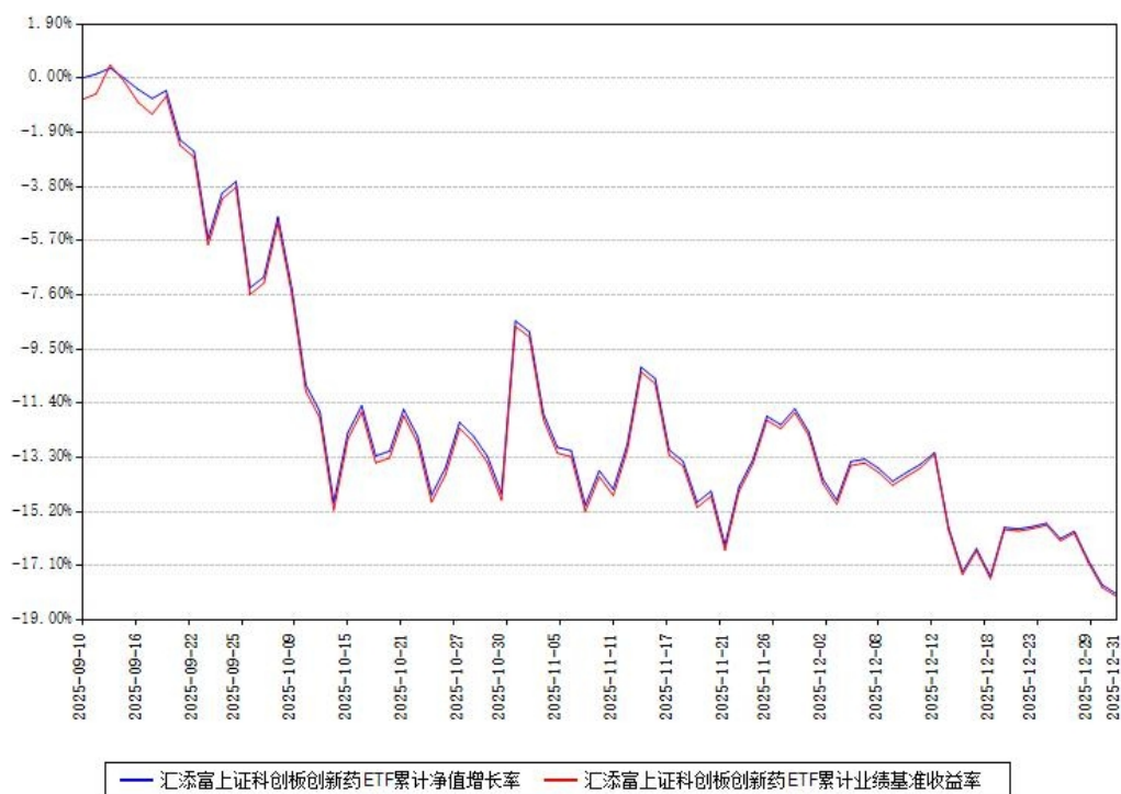
汇添富上证科创板创新药ETF累计净值增长率与同期业绩基准收益率对比图