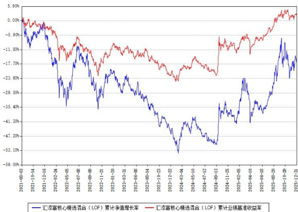
汇添富核心精选混合（LOF）累计净值增长率与同期业绩基准收益率对比图

注：本基金建仓期为本《基金合同》生效之日（2021年08月03日）起6个月，建仓期结