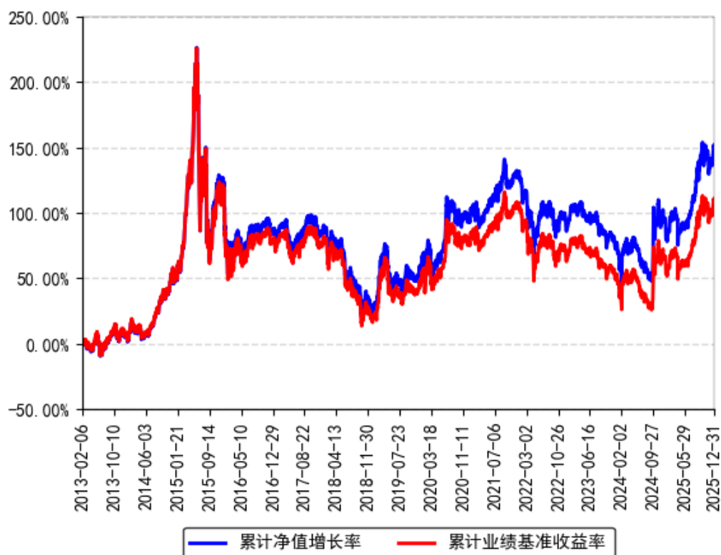
南方中证500ETF累计净值增长率与同期业绩比较基准收益率的历史走势对比图