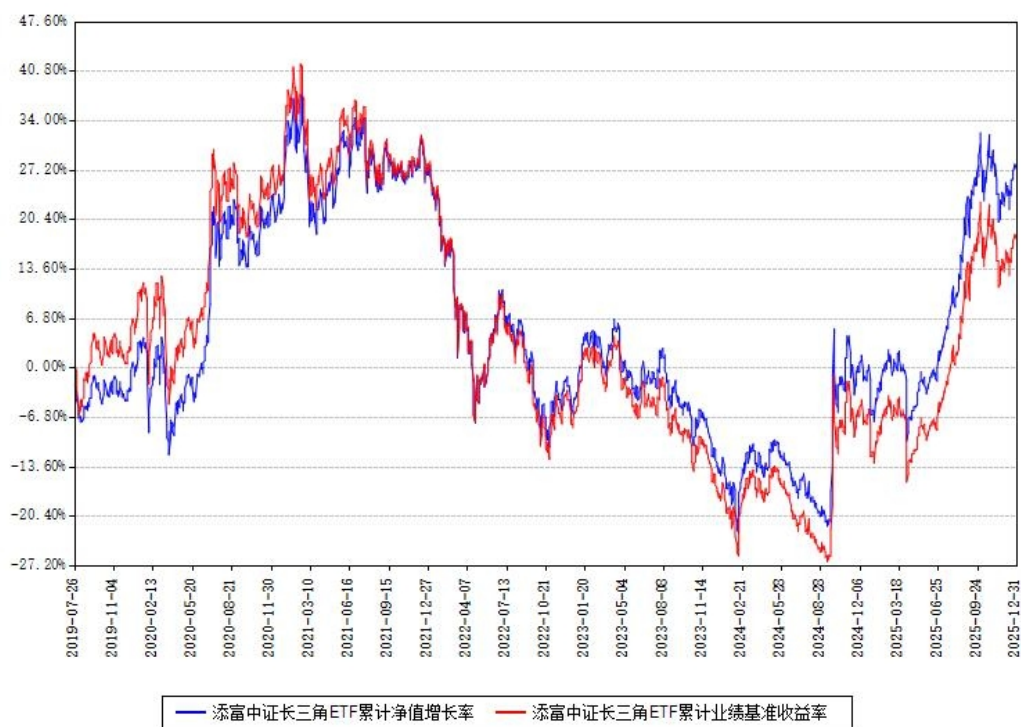
添富中证长三角ETF累计净值增长率与同期业绩基准收益率对比图

注：本基金建仓期为本《基金合同》生效之日（2019年07月26日）起6个月，建仓期结束时各项资产配置比例符合合同约定。