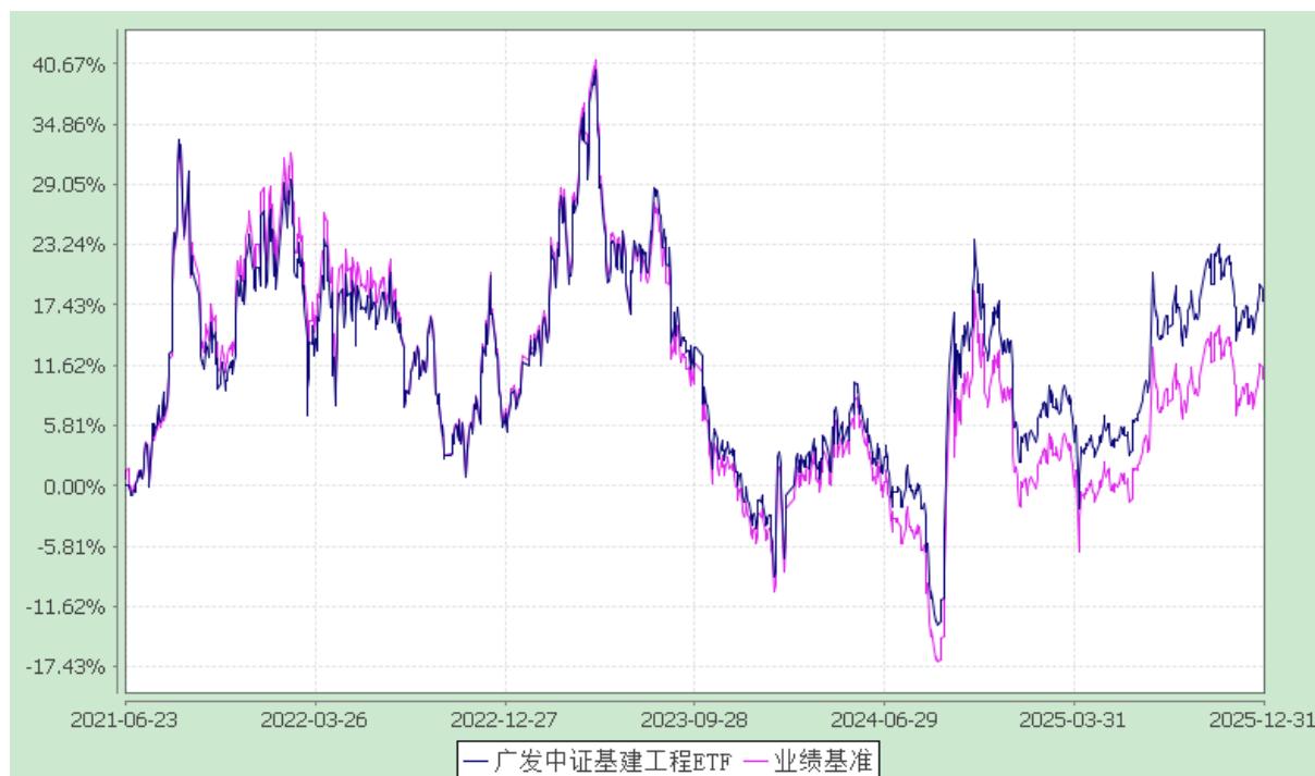
广发中证建设工程交易型开放式指数证券投资基金 份额累计净值增长率与业绩比较基准收益率的历史走势对比图 (2021年6月23日至2025年12月31日)