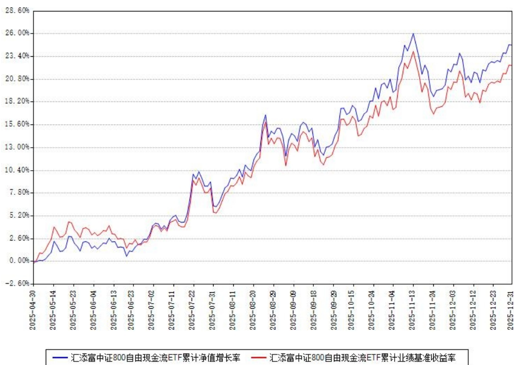
汇添富中证800自由现金流ETF累计净值增长率与同期业绩基准收益率对比图

注：本《基金合同》生效之日为 2025 年 04 月 30 日，截至本报告期末，基金成立未满一年。本基金建仓期为本《基金合同》生效之日起 6 个月，截至本报告期末，本基金已完成建仓，建仓期结束时各项资产配置比例符合合同约定。