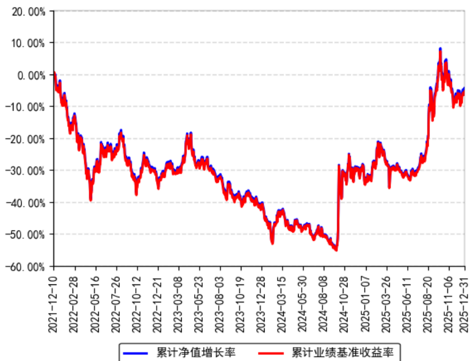
南方上证科创板50成份ETF累计净值增长率与同期业绩比较基准收益率的历史走势对比图