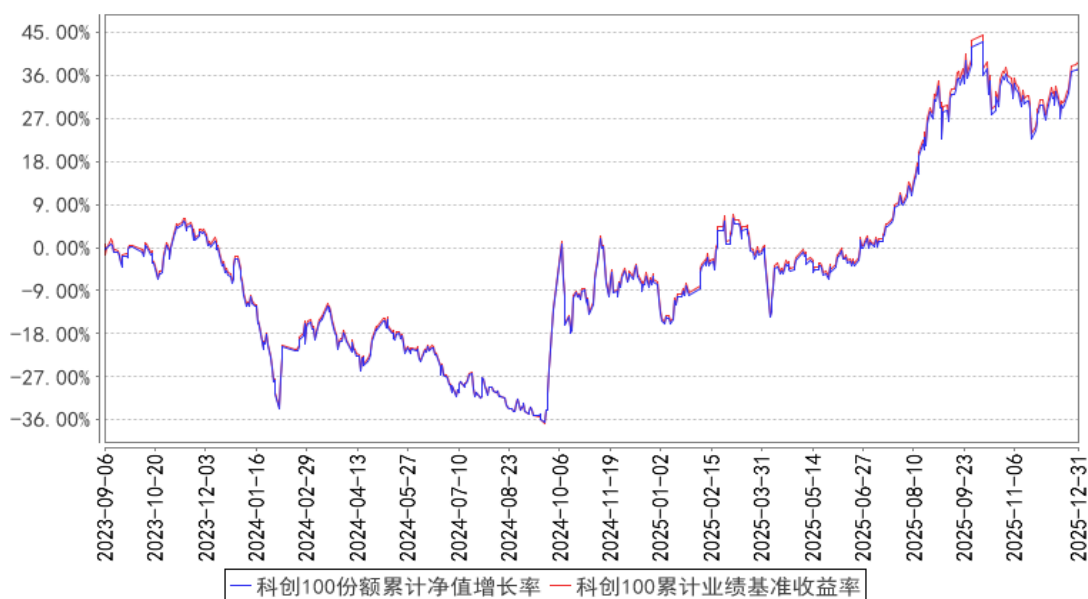
科创100份额累计净值增长率与同期业绩比较基准收益率的历史走势对比图

注：按基金合同的规定，本基金自基金合同生效起六个月内为建仓期，建仓期结束时本基金的各项投资比例已达到基金合同的规定：本基金投资于标的指数成份股及备选成份股的资产不低于基