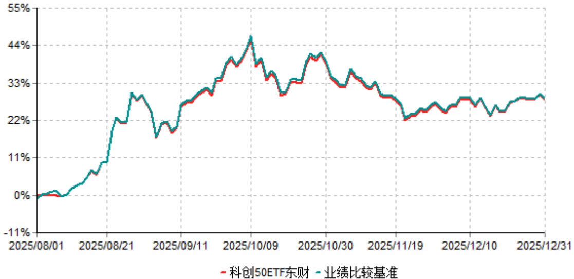
科创50ETF东财累计净值增长率与业绩比较基准收益率历史走势对比图 (2025年08月01日-2025年12月31日)