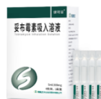
健可妥® 妥布霉素吸入溶液