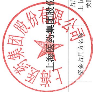
上海医药集团股份有限公司 2025 年度非经营性资金占用及其他关联资金往来情况汇总表