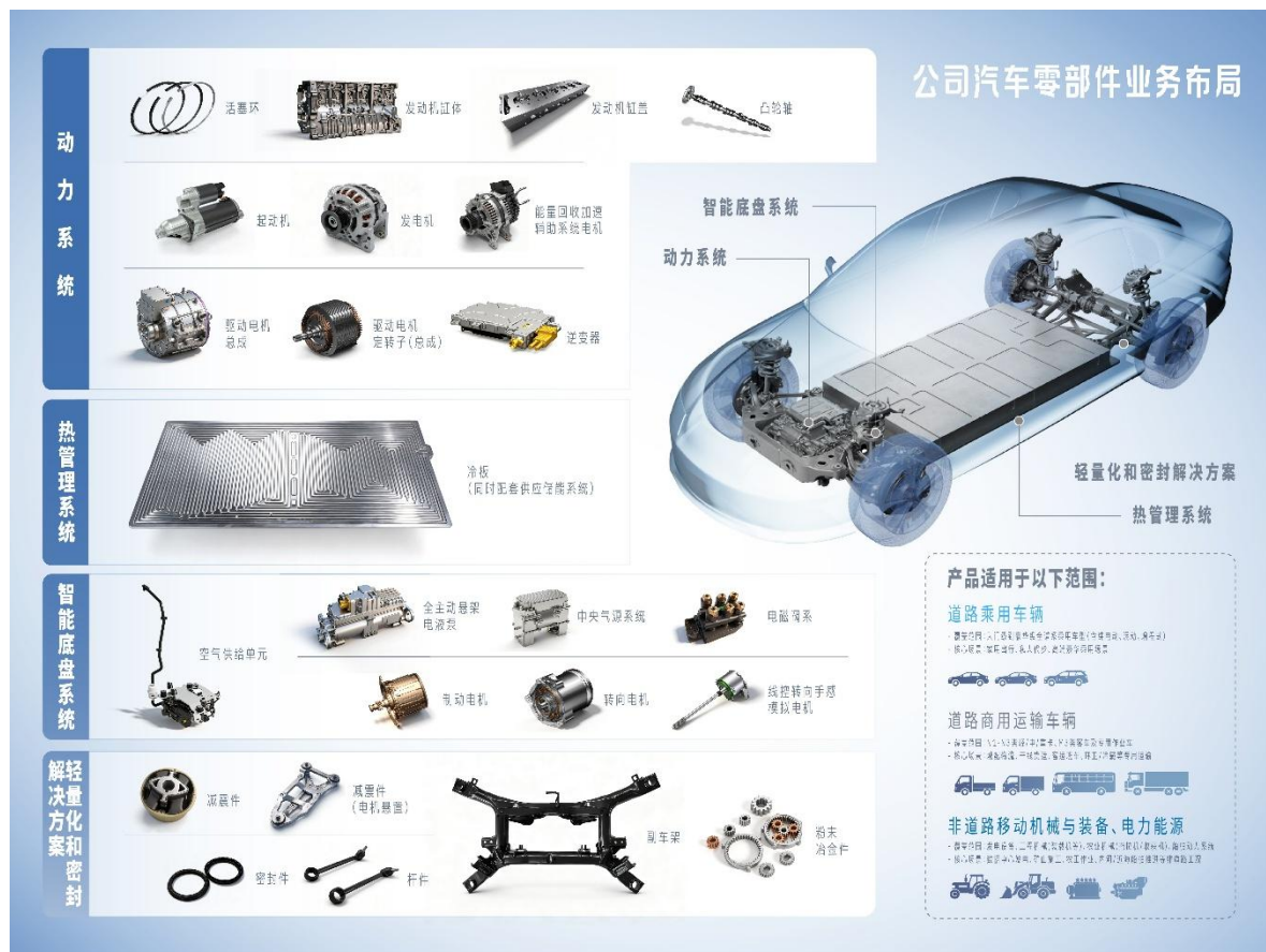
图 4 公司汽车零部件业务布局

对成熟的批量产品，会结合市场状况，生产一定数量的成品进行备货，以及时满足客户的临时采购需求。具体生产模式包括自主研发、来图加工和合作开发等。多数类型的产品针对国内及国外客户均采用直销的销售模式，部分产品针对国外客户代销与直销模式均有采用，同时还在大力开拓国内外售后市场。以销定产的生产模式下，销售部门会根据订单实际情况制定销售计划，生产部门再根据销售计划制定生产计划，之后采购部门根据生产计划安排相关原材料的采购。