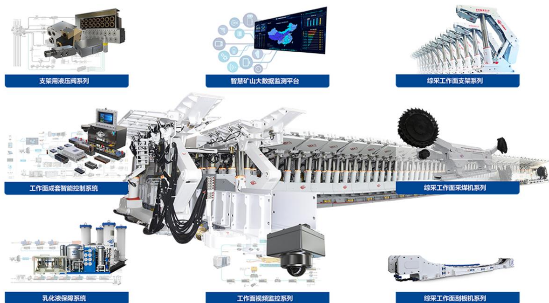
图 1 公司煤机业务板块主要产品

公司煤机板块主要业务为煤炭综采装备及其零部件，为全球煤炭客户提供安全、高效、智能的一流的煤矿综采技术、成套装备解决方案和服务。液压支架、刮板输送机、采煤机是煤炭综采工作面的主要设备，与转载机、输送机等组成一个有机的整体，实现了井工煤矿工作面落煤、装煤、运煤、顶板支护和顶板管理等主要工序的综合机械化采煤工艺。其中液压支架支撑和控制煤矿工作面顶板，隔离采空区，防止矸石窜入工作面，保证作业空间，并且能够随着工作面的推进而机械化移动，不断地将采煤机和输送机推向煤壁，采煤机滚筒实现落煤、装煤，刮板输送机运煤。综采改善了煤矿劳动条件，大大提高了工作面产量和效率，提升了工作面安全性。