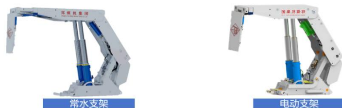
图 2 常水支架和电动支架产品