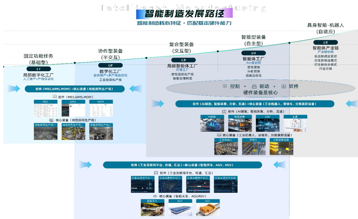
图 6 智能工厂业务分布图