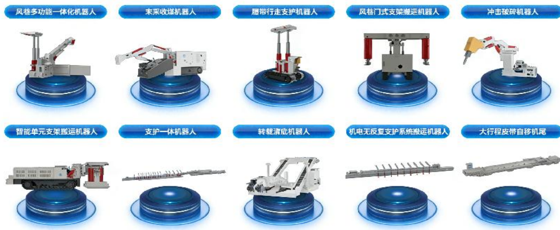
图 3 十大矿用辅助作业机器人